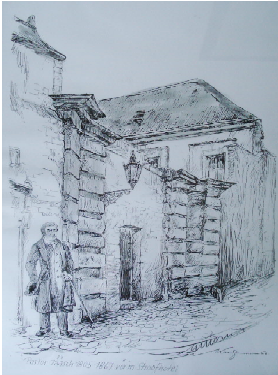
Die Federzeichnung zeigt Pastor Jääsch vor dem „Stroofhotel“