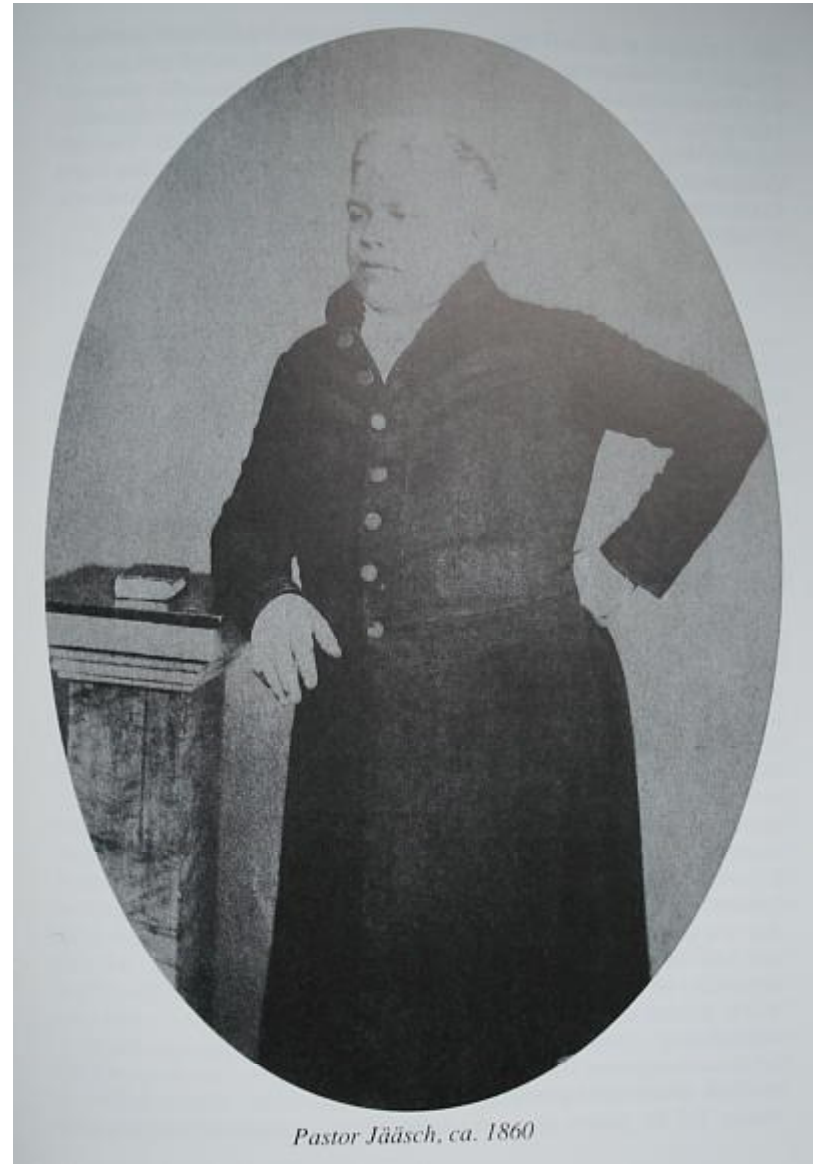
Bilder aus dem Buch von Thomas Schatten