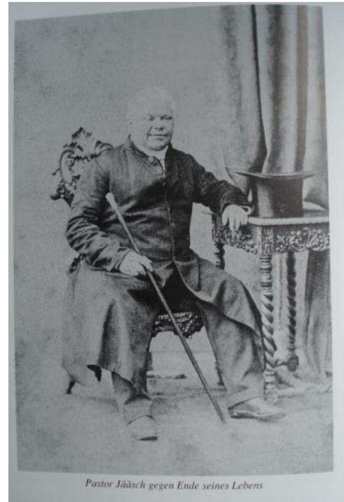
Bilder aus dem Buch von Thomas Schatten