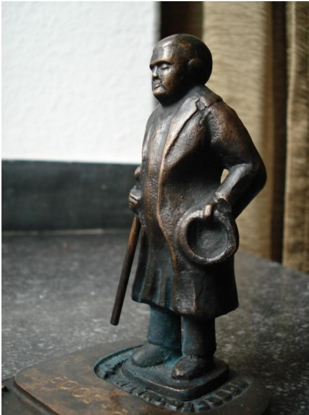
Pastor Jäsch Bronzeskulptur von 2005